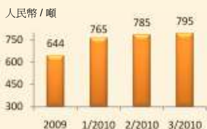
原焦煤首季每月平均售價